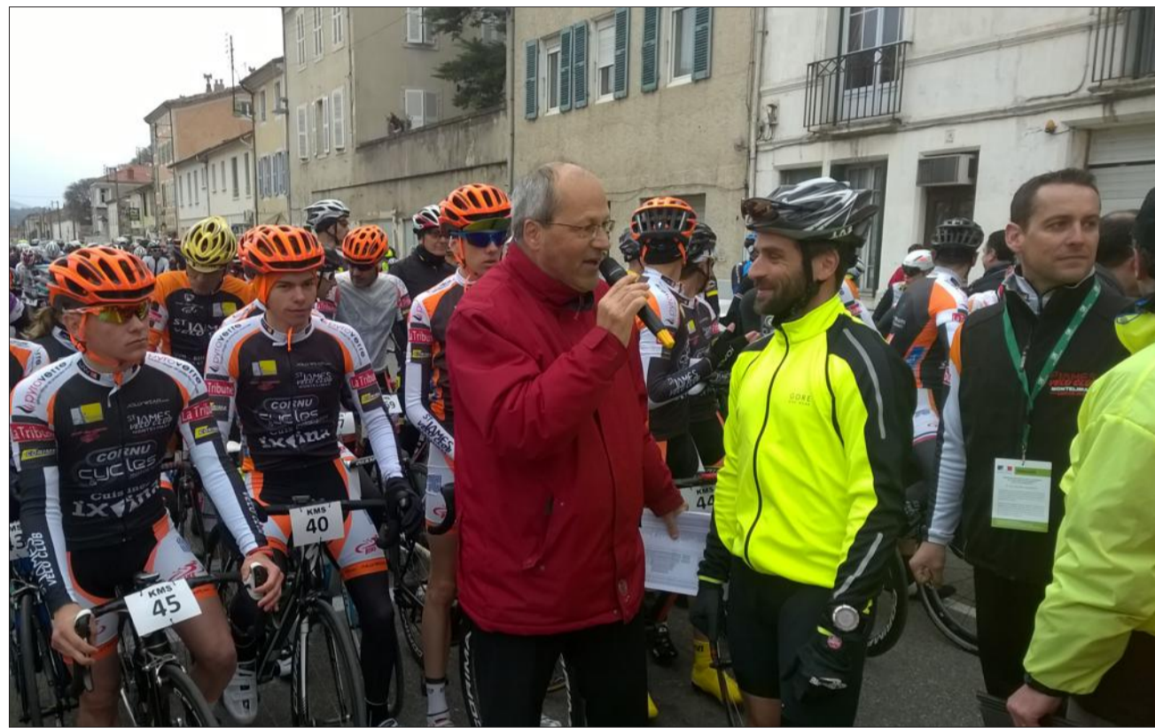
L'année dernière, Arnaud Clément, ancien joueur de tennis et ex-capitaine de l'équipe de France de Coupe Davis, avait pris le départ. Le D.U.S.D.

Il va y avoir du changement cette année sur la Corima Drôme provençale. À un mois de l'événement, les organisateurs sont passés à la vitesse supérieure pour que tout soit parfait le jour J (voir ci-dessous). La grande nouveauté, ce sont les parcours qui ont tous été modifiés. Et les concurrents vont vite s'en rendre compte car les difficultés vont s'enchaîner dès les premiers kilomètres. Si lors des précédentes édi-