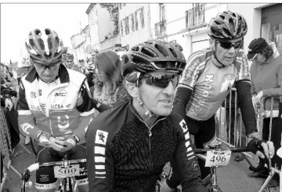
ANONYME. Alain Prost s'est fondu dans la masse des 1500 concurrents de cette première Corima Drôme Provençale, Ce qui ne l'a pas empêché de prouver qu'il a de bonnes jambes.

"Lors de la saison 92-93, lorsque j'ai pris une année sabbatique en F1, j'ai voulu conserver une bonne forme physique. Ayant des problèmes de genoux, sur les conseils de mon ostéopathe, je me suis mis au vélo car c'est un sport moins traumatisant que d'autres. La même année a été créée l'étape du tour et cela constitue chaque