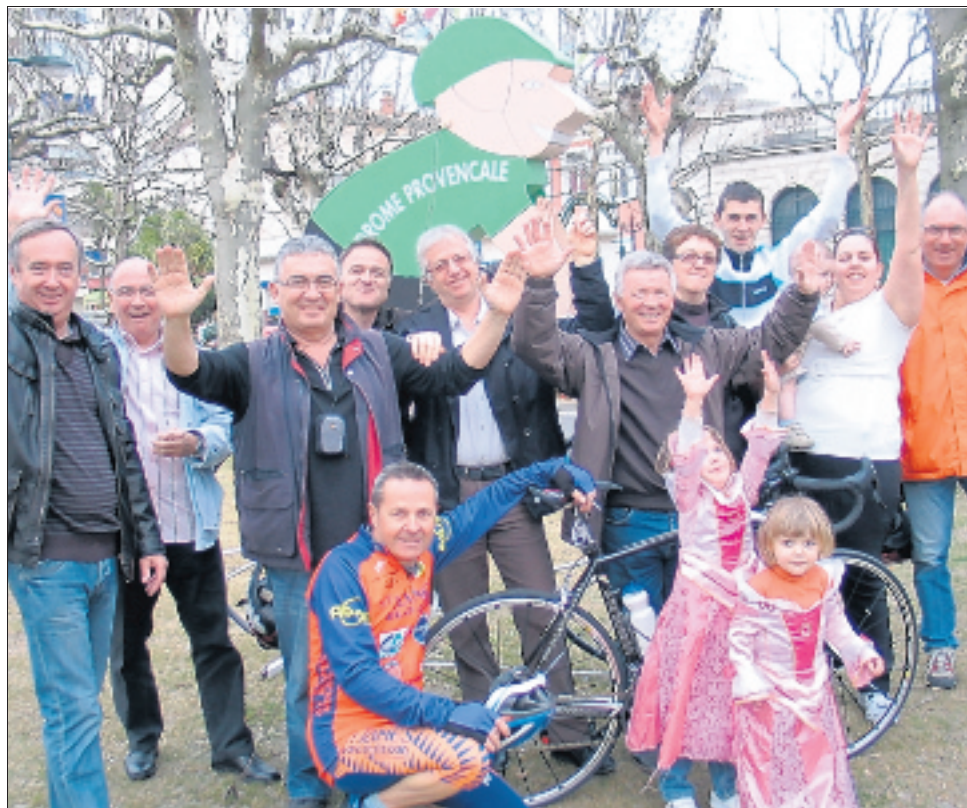
Les organisateurs de la Corima provençale attendent le jour du départ avec impatience.

10 personnes composent le comité d'organisation Pour la réalisation de la première édition de la Corima Drôme provençale, un comité d'organisation a été spécialement mis en place au sein du club de vélo montilien. Le Saint-James vélo club a créé cette course "sur les cendres" de la "Nougalolette", une randonnée qui existait depuis dix-sept ans. Ne comptant pas